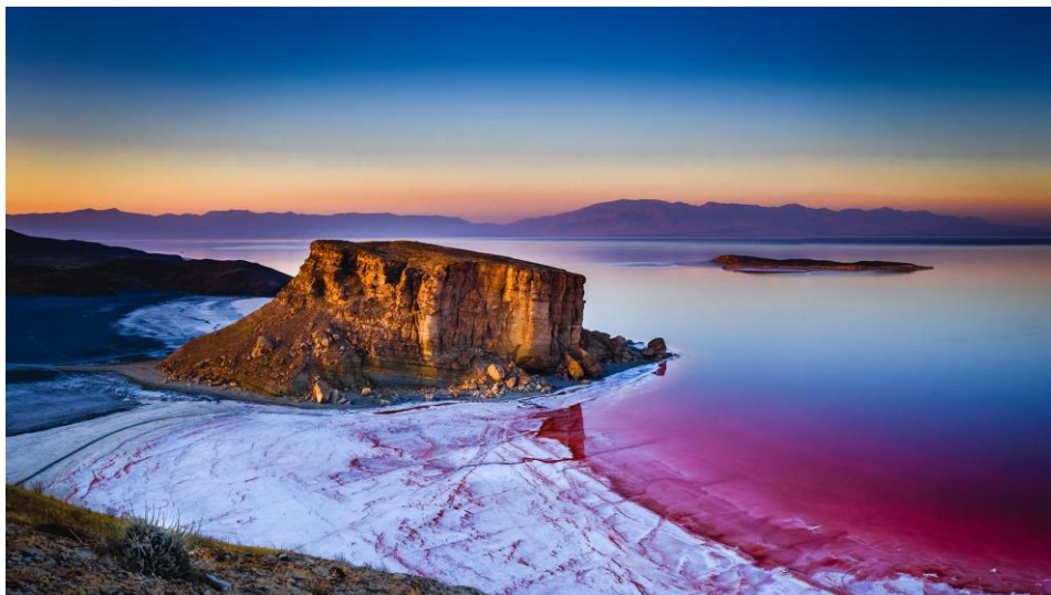
وینەى (2). گۆرپانكارى لە پىكھاتەى ئاوى گۆلى ورمى و خەستىبونەوہى رىژەى خویپەكان بەرچاودەكەوینت

نىگەرانىپەكى تر دەگەرپىتەوہ بۆ كارتىكرىدى خوی لە سەر پىستى مرۆڤ و ئازەلەكان. ھەرچەند ئۇم بابەتە نەخراوہتە ژىر توپىژىنەوہوہ، بەلام بە دىنپىپەوہ كارىگەرىپەكى لەم جۆرە بۆى ھەپە كە لەسەر جەستەى مرۆڤ بەگشتى و لەسەر پىستىدا دروست بىپىت.