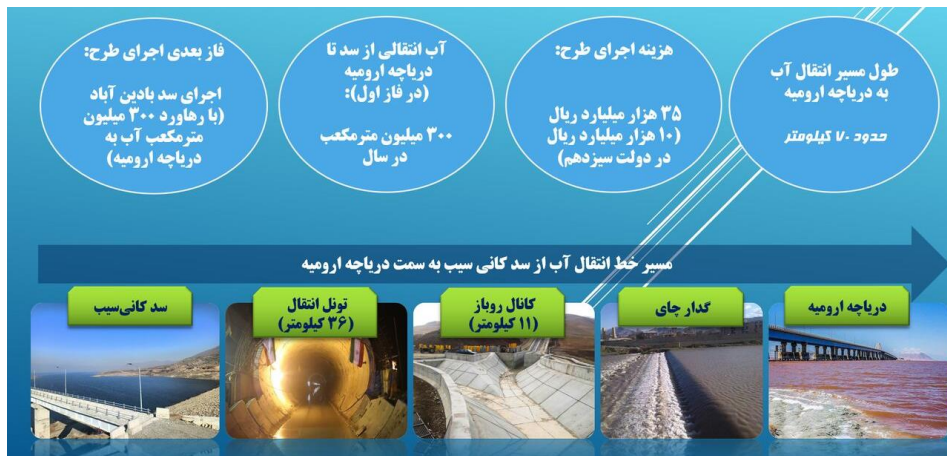
وینه ی (4). ئینفۆگرافیکی پروژه ی کانی سیو سه باره ت به گواستن وهی ئاو به در یژی 70 کیلۆمه تر. به م پییه سالانه 300 ملیۆن ئاو له به نداوی کانی سیو و دواتر له به نداوی بادیناوی بۆ پووباری گادار ده گوازیته وه. کانال و تونیل بۆ ئەم مه به سه ته به کار دیت.

خواردنه وه و پیشه سازی به کانی ناو نیلی بادیناوی بۆ ده ریچاچهی ورمی، کۆنترۆل کردن و ریکخستن ئاو و چاره سه رکردنی به شیک له دابه زینی ئاستی ئاو له گولی ورمی. هه ندی له تاییه ته ندییبه ئەندازه ییبه کانی پروژه که به م شیوه یه باسکراوه: هه لکه دندی تونیلی گواستن وهی ئاو که در یژی به که ی نزیکه ی 17.2 کیلۆمه تر و قه باره ی گواستن وهی له سالی کدا 646 ملیۆن مه تر سیجا ده بییت.