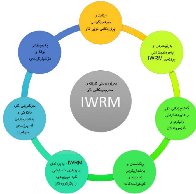
وټنه‌ی (4). پیکهاته‌ی به‌پړیوه‌بردنی ئاویته‌ی سرچاوه‌کانی ئاو (IWRM)

لایه‌نانه ده‌کات که ئه‌رکی سه‌رپه‌رشتیکردنی حوکمرانی ئاویان پیسپیدراوه. توټیڼه‌وه‌کانی په‌یوه‌ندیدار به سیاسته‌ته سرکه‌وتوه‌کانی به‌پړیوه‌بردنی ئاو، له سه‌رانسه‌ری جیهان تیروانینیکی به‌نرخ بؤ دارپشتنی پیکهاته‌ی حوکمرانی کاریگر پیشان دده‌ن.