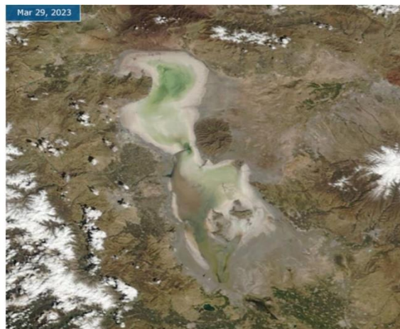
وینەى (1). گۆرانکاری پووبەرى گۆلى ورمى لە نیوان سالانى 2001 تا 2023 سەرچاوه: NASA; Shrinking Lake Urmia

كەمبوونهوهى ئاوى، ئیکۆسیستەمى دەریاچەكەى تیکداوه و لە ئەنجامدا ژمارەى چەندین جۆرى پووهك و ئازەل كەمبوونهتهوه یا لەناوچوون، لەنیویاندا بالنده كۆچبەرەكان. لەگەڵ ئەمەشدا ئەم لیکهوتە نەرینیانه بەشیۆهیهكى بەرچاوى بەدى دەكرین: پامالینی خاك و تەشەنەى بەبیابانبوون لە ناوچەكەدا بەهۆى وشكبوونى بەستینی دەریاچەكە، لەدەستدانى زهوییه بەپیت و ناساییهكان و بوونیان بە شۆرەكات بەهۆى هەلگردنى خۆلبارین و خۆیبارین و لە كۆتاییدا دابەزینی دەولهەمەندى و جۆراوجۆرى زیندەوهەران.